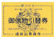
↑↑ お供物引換券 (黄色)